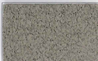
SR-E7010 茶 Brown

※ここに示したデータは全て実測値であり、保証値ではありません。 ※The data indicated here is surveying numerical value, not guaranteed numerical value.