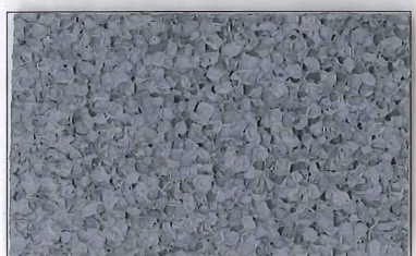
SR-E7010 灰 Gray