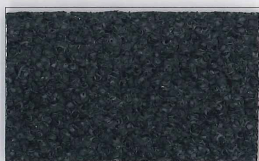
SR-E7010 黒 Black